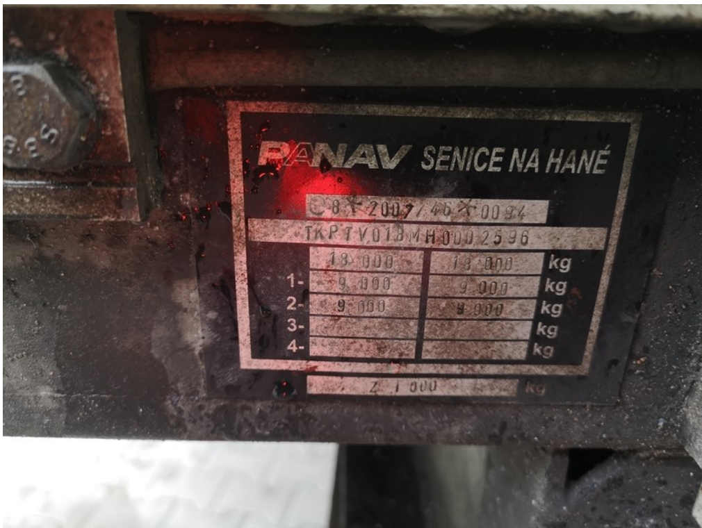
VIN / výrobní štítek