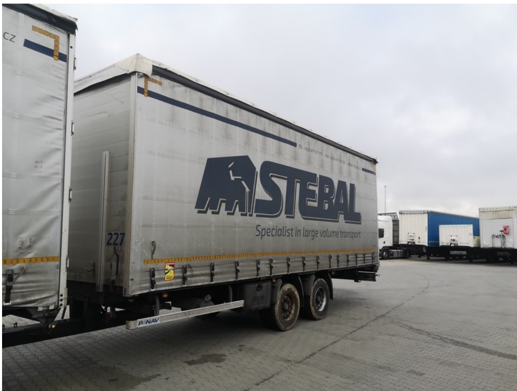
Pohled zepředu zleva