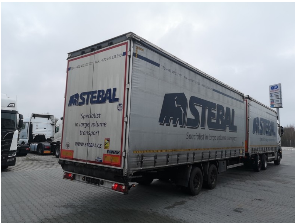
Pohled zezadu zprava