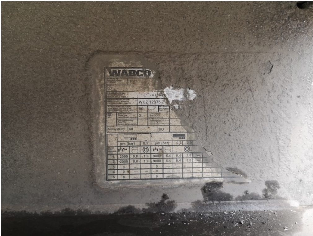
VIN / výrobní štítek