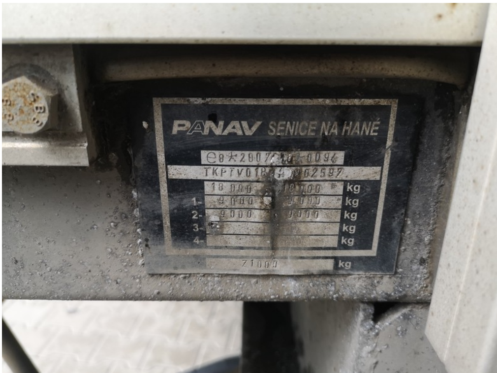
VIN / výrobní štítek