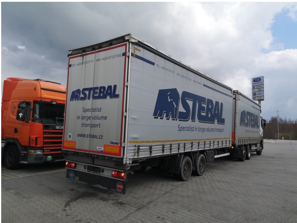
Pohled zezadu zprava