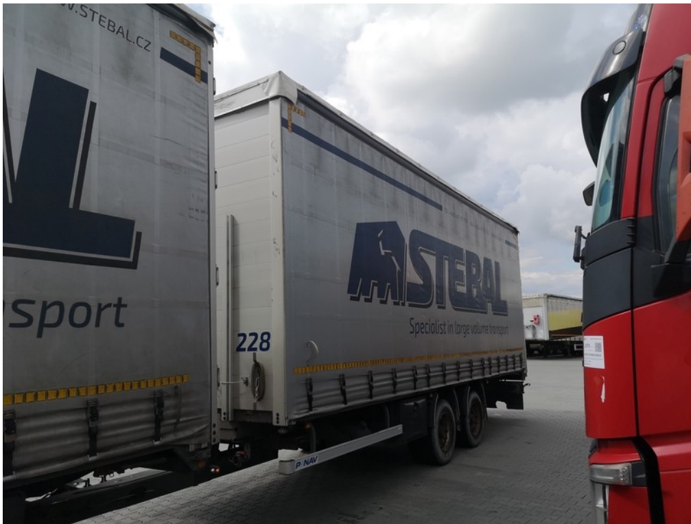
Pohled zepředu zleva