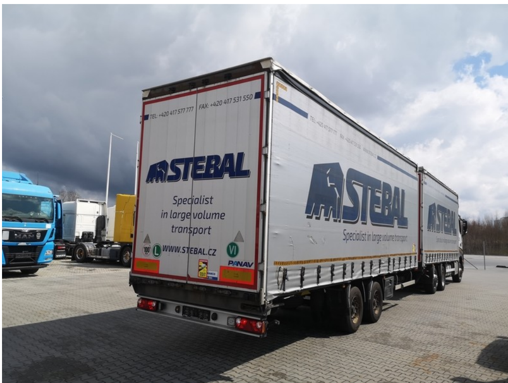
Pohled zezadu zprava