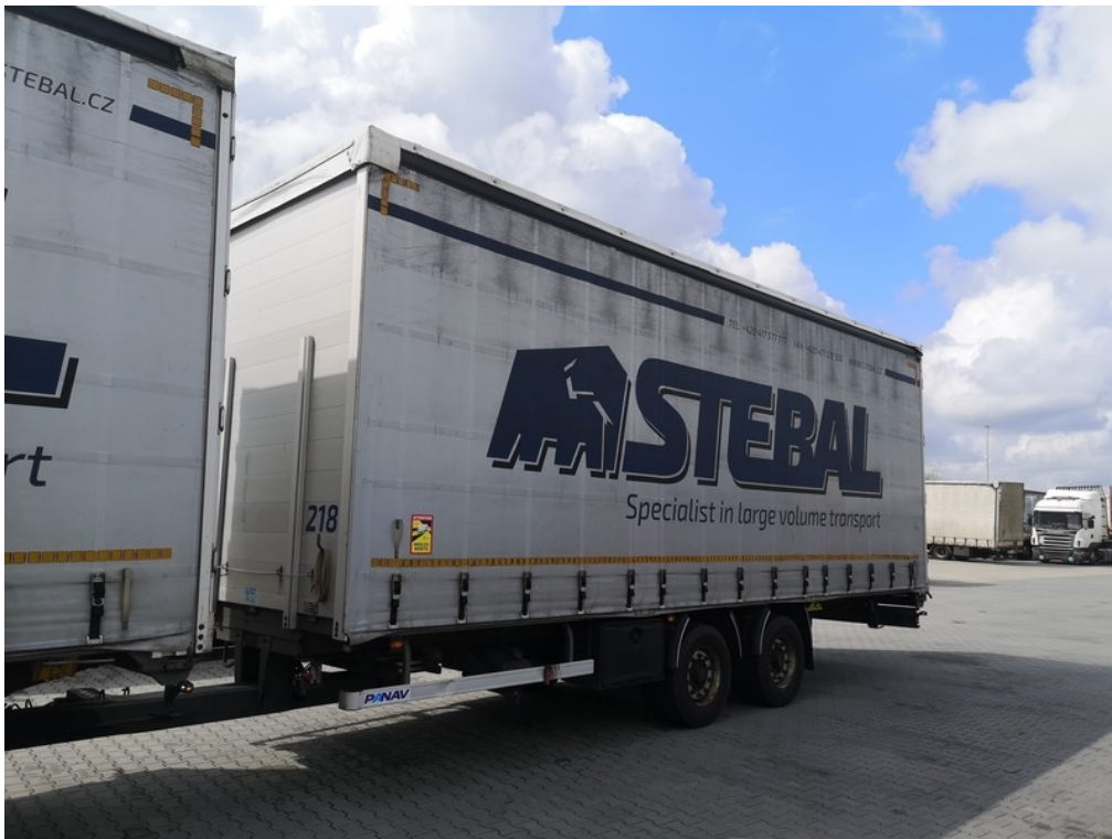
Pohled zepředu zleva