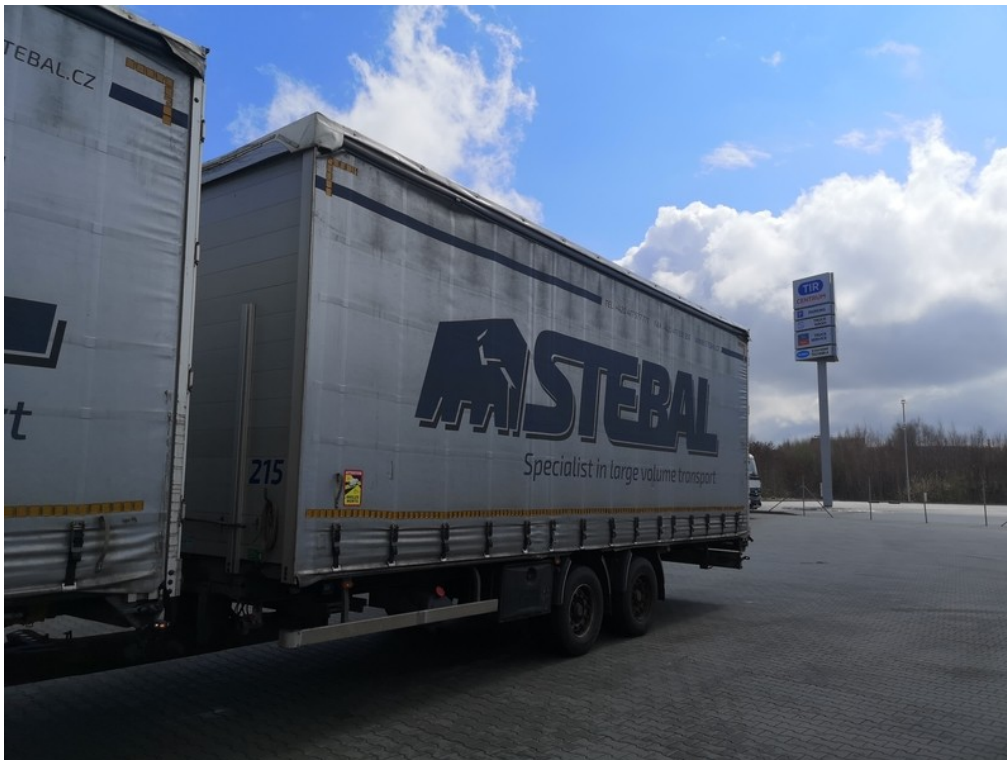
Pohled zepředu zleva