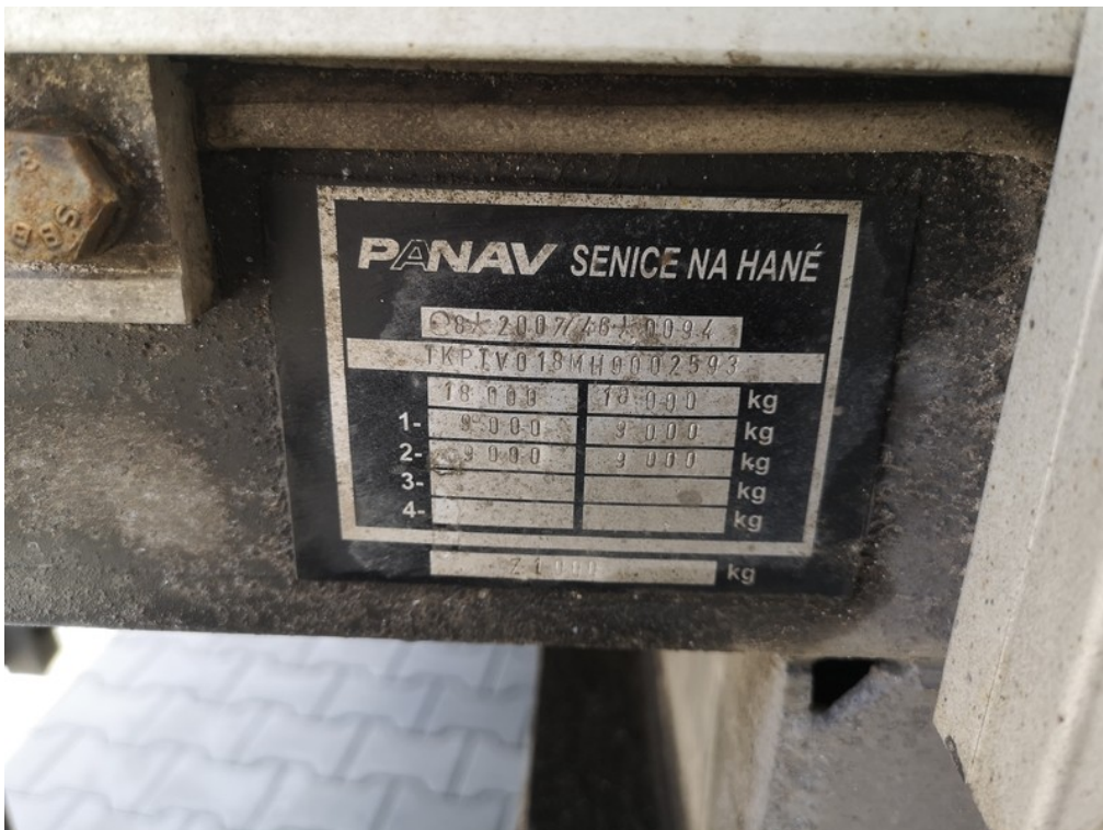
VIN / výrobní štítek