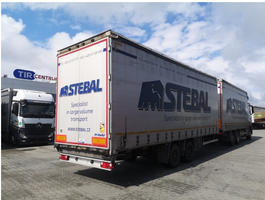
Pohled ze zadu zprava