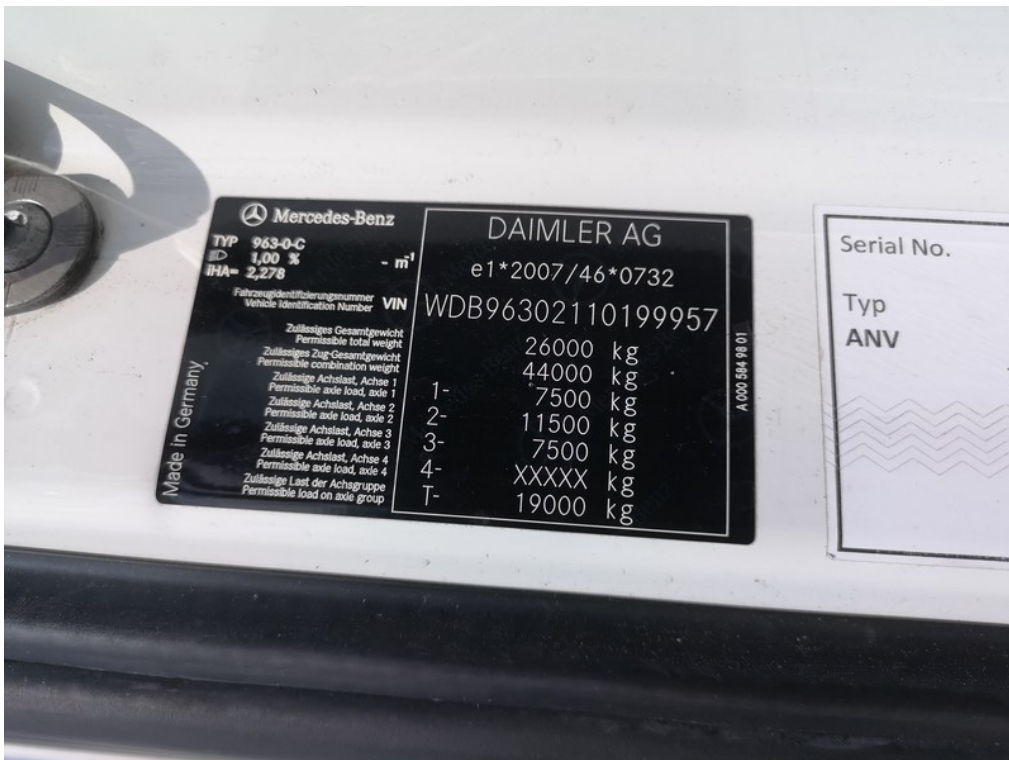
VIN / výrobní štítek