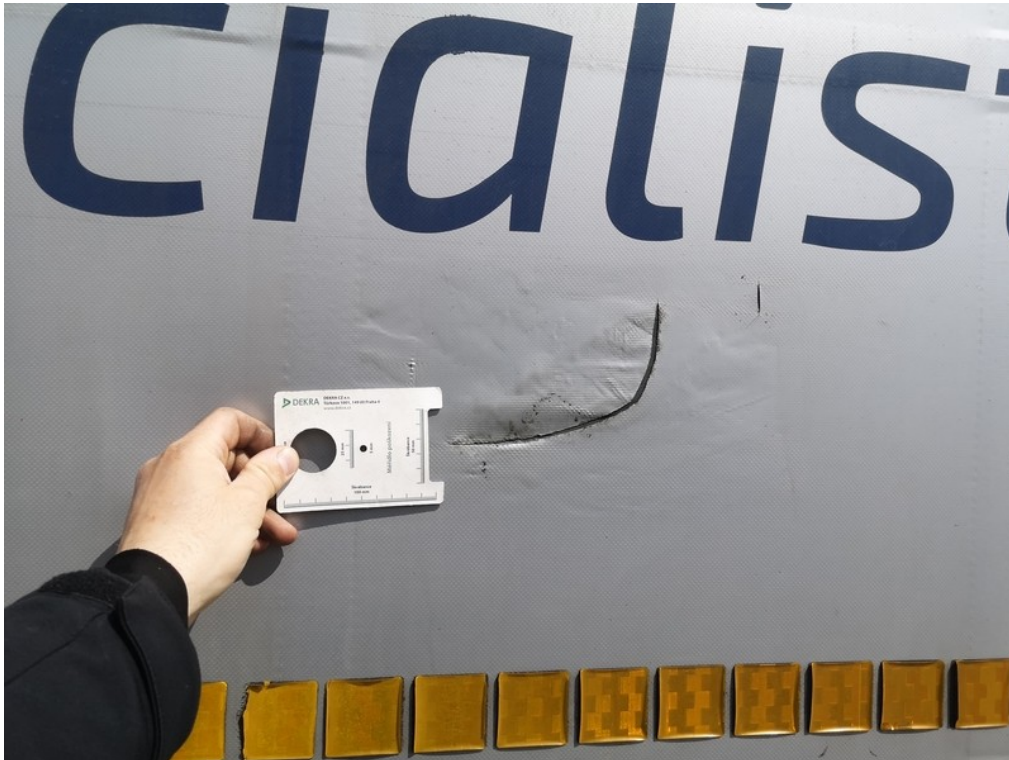
Viz popis k poškození č. 22