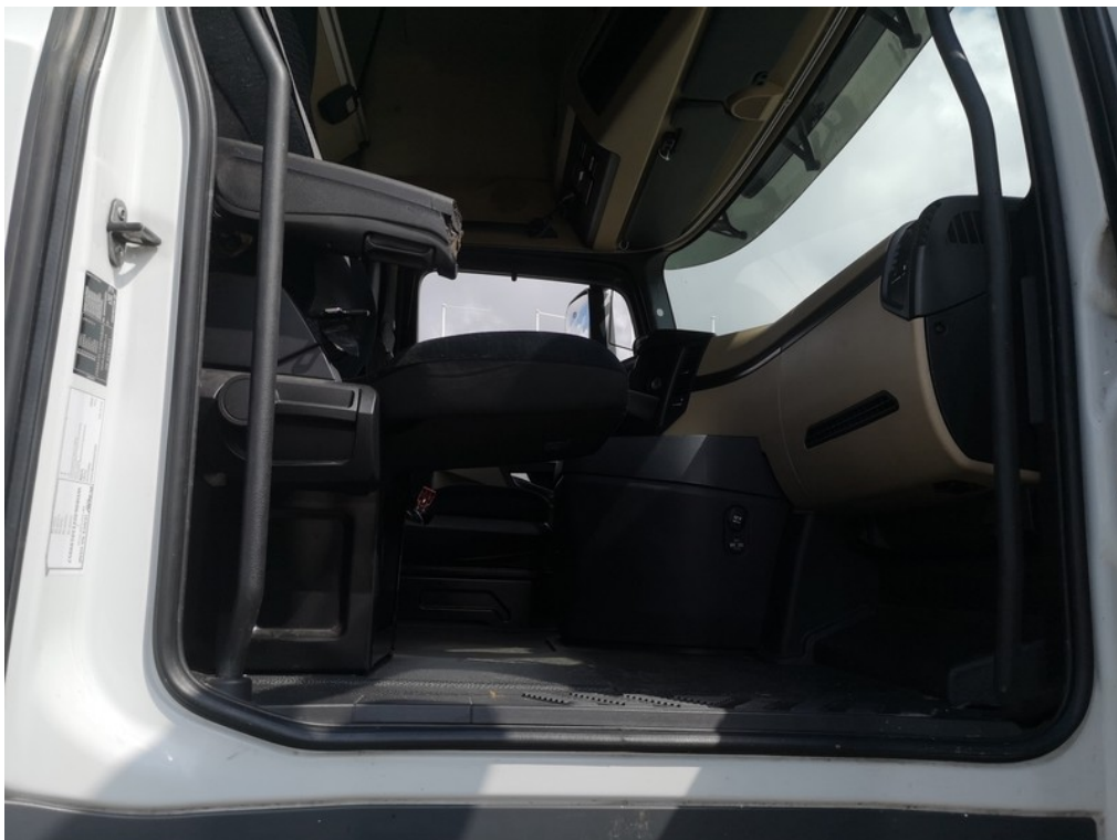
Interiér z pravé strany