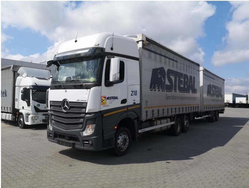
Pohled zepředu zleva