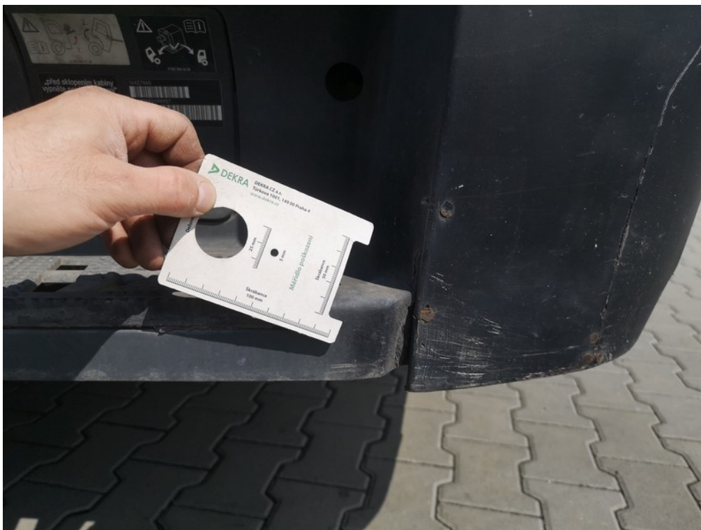
Viz popis k poškození č. 26