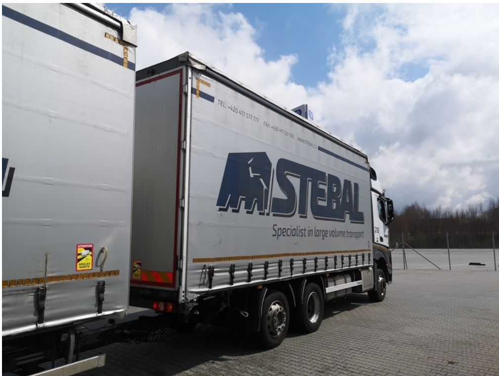
Pohled zezadu zprava