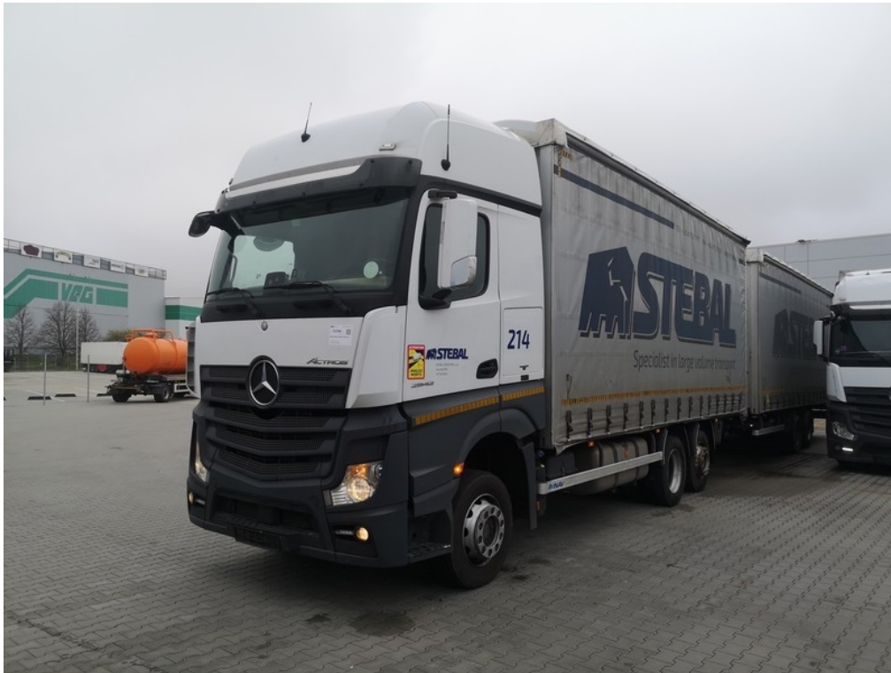
Pohled zepředu zleva