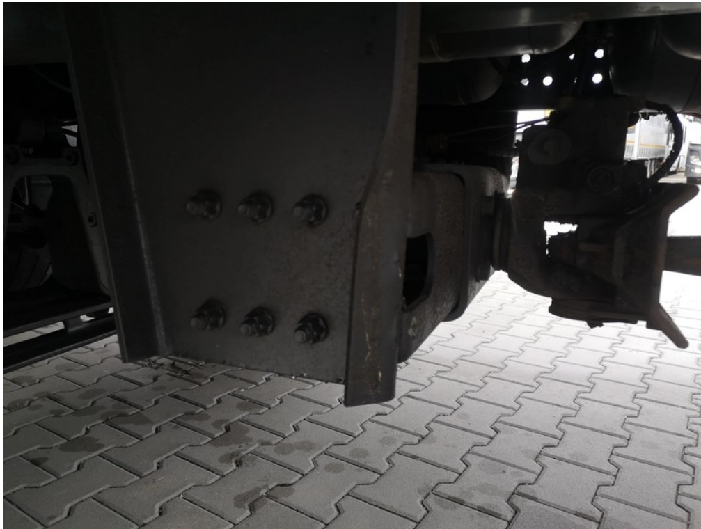
Viz popis k poškození č. 25