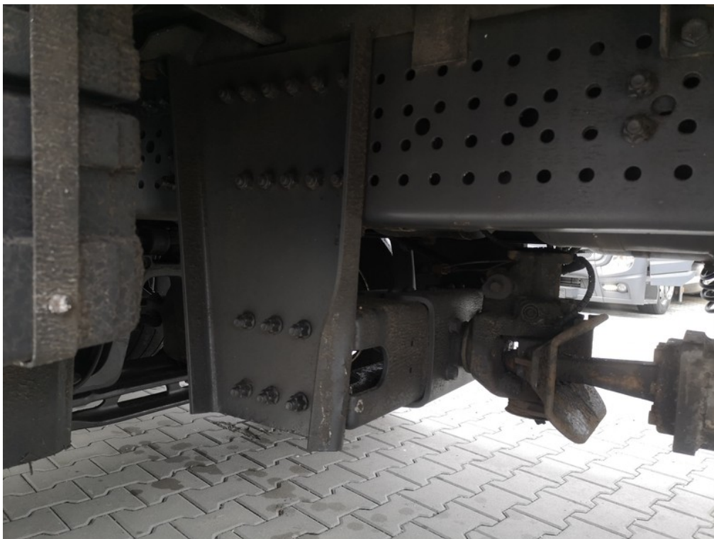
Viz popis k poškození č. 25