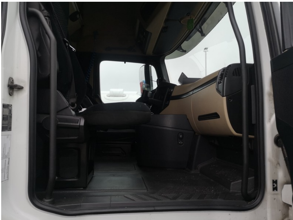
Interiér z pravé strany