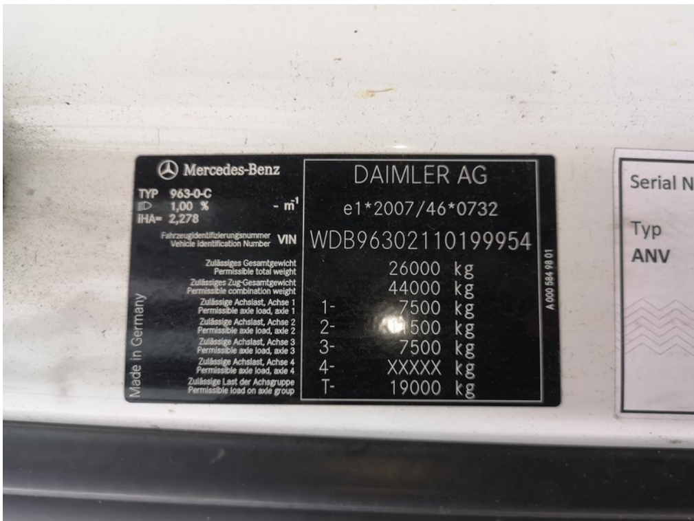
VIN / výrobní štítek