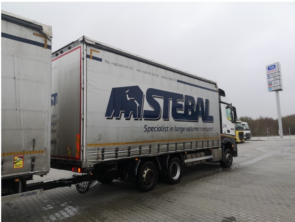
Pohled ze zadu zprava