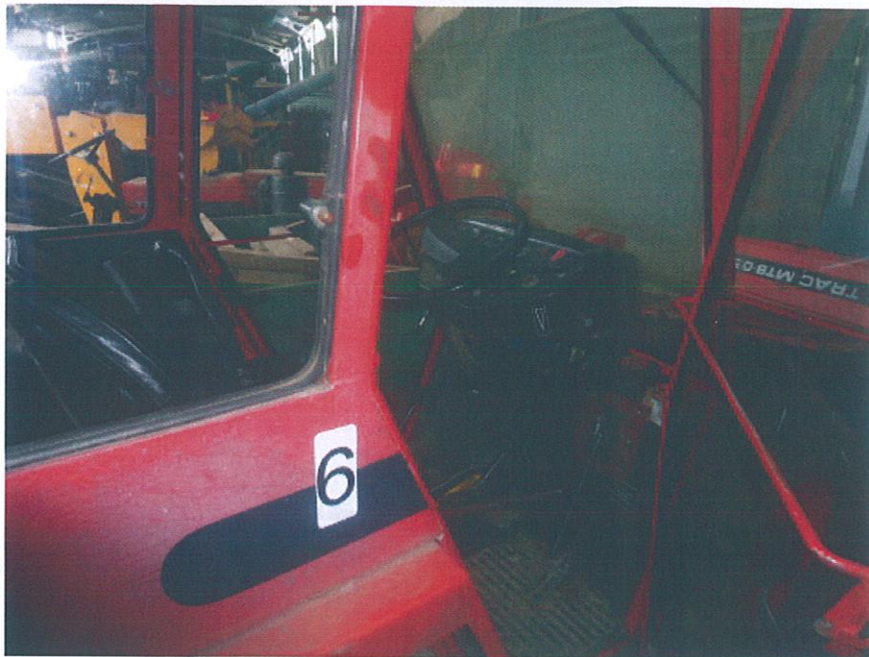
UT 6/16 Malotraktor - interiér