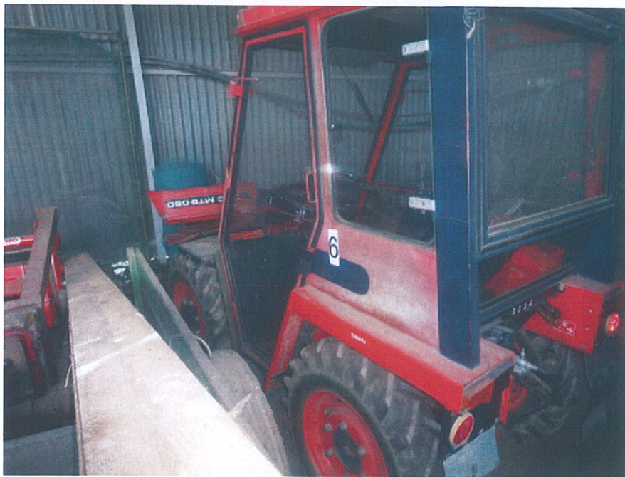
UT 6/16 Malotraktor – pohled zleva