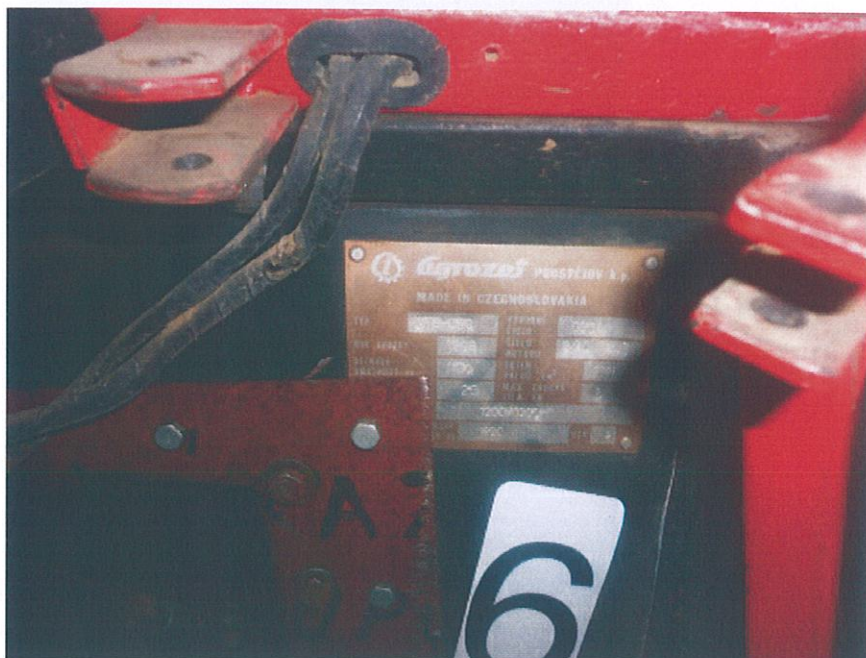
UT 6/16 Malotraktor – výrobní štítek